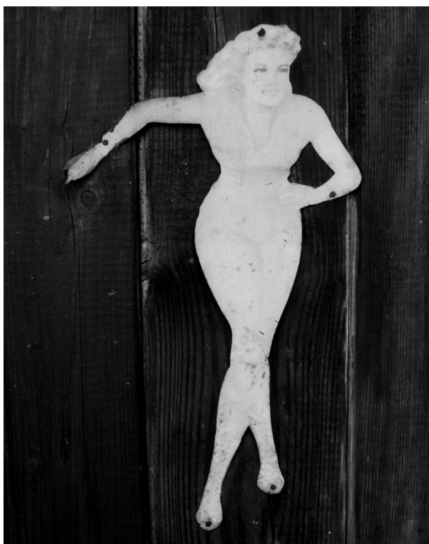
„A odešel na toaletu“

Budiž bohu žalováno, že první skupina zde vystavených fot a jejich pojmenování je v mém vjemu a názoru jednoznačně bohatší. Například obrázky nazvané Ten se bude divit... , A odešel na toaletu , či Drtily vše, co jim stálo v cestě , ale i enigmatičtější Nechtěl, nechtěl, volaly mladé dámy... anebo Itálie vstoupila do Války , či třeba Šel jsem si lehnout mi sdělují cosi, co mě zajímá a co se po mém soudu skutečně děje, i když pohříchu za oním pověstným druhým, třetím či třeba i patnáctým rohem. Některá jiná spojení – typicky To jsem já, Jindřich, volal jsem na ně , ovšem nade mnou takovou moc nemají. Tedy a ovšemže: vy – nikoli já – si račte vybrat.