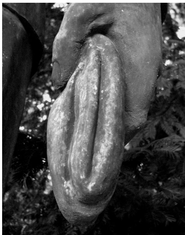
„Ten se bude divit...“

Přes tyto kontextuální dekontextualizace (to je už dnes poslední sprost'árna, čestné slovo) bych přece jen rád věnoval drobnou pozornost fotografiím samým, neboť se domnívám, že právě spontánně zachycované obrazy a jejich vlastní, okamžitě vzniknuvší objevné kontexty jsou autorovým nejsilnějším místem – jak to ostatně u fotografů bývá – a to i se