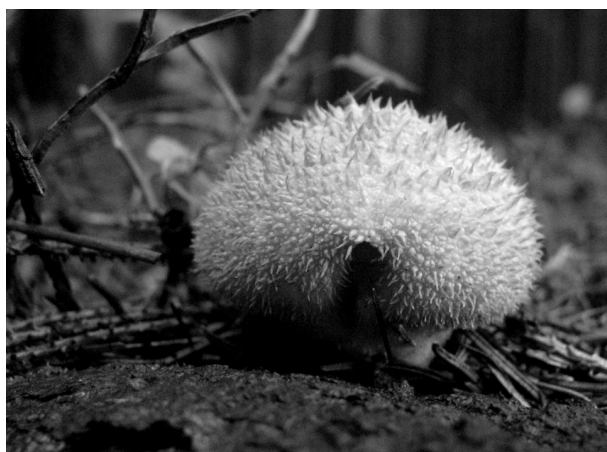
„Nechtěl, nechtěl, volaly mladé dámy...“

Tyto dva příběhy mají po mém soudu společný základ v absurditě, ukryté v samé podstatě lidské komunikace, či snad komunikativnosti jako takové – oba jsou vlastně jakousi hrou na příběh a sdělení, jež z možné a reálné omylnosti výpovědi, činí omyl její funkčnosti – a z tohoto obrácení, či spíše vyvrácení smyslu se jakoby odpaňuje – ne-li přímo emanuje – uspořená energie, dávající vzniknout absurdnímu humoru.